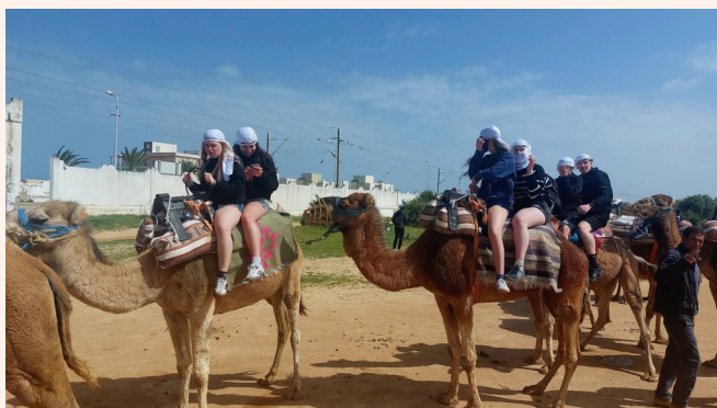
Séjour en Tunisie

Dans le cadre de nos activités de loisirs, voici quelques photos illustrant à la fois les accueils de loisirs et les séjours de vacances qui se sont déroulés aux vacances d'Automne, d'Hiver et de Printemps.