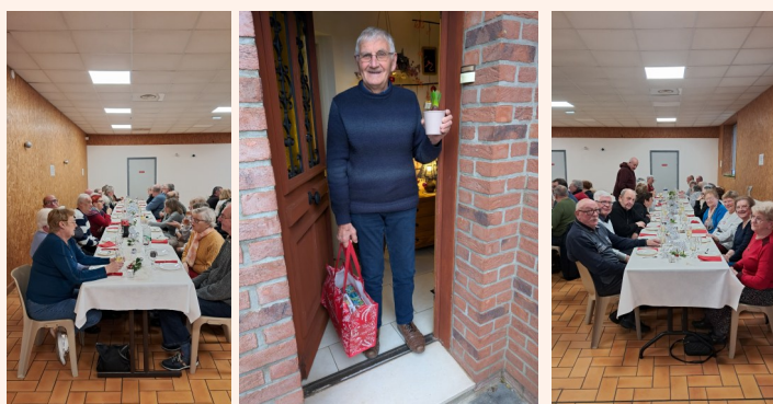
Goûter et distribution du colis des aînés