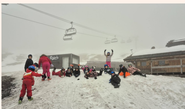
Séjour ski à Montriond