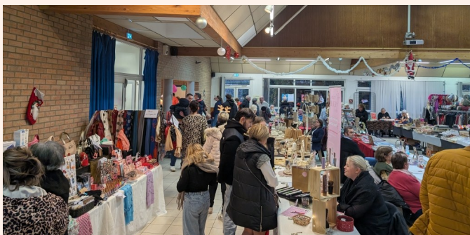
Marché de Noel de Norrent-Fontes