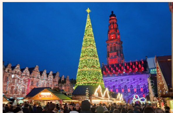
Marché de Noël d'Arras