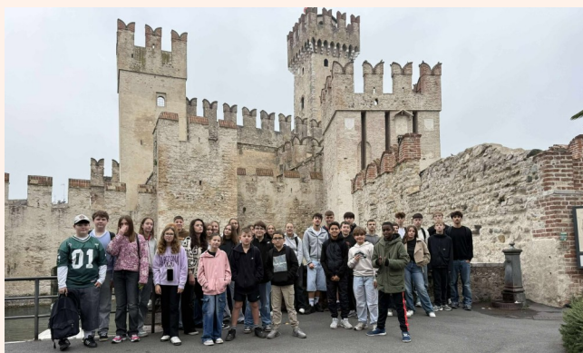
Séjour en Italie autour du Lac de Garde

Malheureusement, pour les prochaines périodes de vacances scolaires, nous ne pourrons plus satisfaire toutes les familles souhaitant inscrire leur (s) enfant(s) sur l'un de nos séjours, l'arrêt du financement du dispositif « colos apprenantes » aura pour effet de restreindre de manière conséquente le nombre de séjours de vacances.