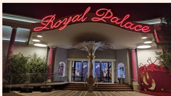
Voyage en Alsace