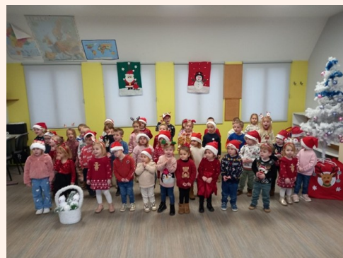
Chorale des maternelles

Animation nature au Marais Pourri (classe de CE1/CE2) à la découverte des « petits peuples du sol » : travail autour de la décomposition, du rôle des petites bêtes.