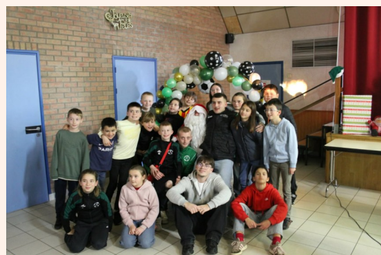
Gouter des Intrépides

Comme chaque année, plusieurs animations étaient proposées durant la période de Noël par la municipalité et les associations : Marché de Noël dans la commune, à l'école mais également les sorties à Arras, en Alsace et à Bruxelles, goûter des Intrépides, remise des colis et goûter pour les aînés, animation récréative pour les enfants, et enfin vente de sapins et de coquilles de Noël.