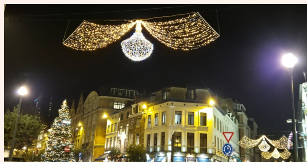
Marché de Noël de Bruxelles